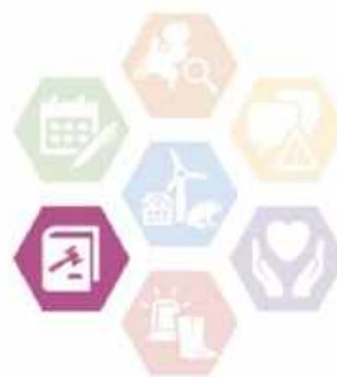
Figuur 1: Reguleren en borgen is een van de zeven ambities van het DPRA

Op initiatief van BZK en DPRA is de werkgroep 'Verkenning (bouw)regelgeving t.b.v. klimaatbestendige inrichting' opgericht, om bovenstaande doelstelling verder uit te werken. 1 Op verzoek van deze werkgroep is onderzoek gedaan naar knelpunten bij klimaatadaptief bouwen en inrichten en een advies uitgebracht over mogelijke oplossingsrichtingen. 2 Uit het onderzoek komt naar voren dat het huidige wettelijke stelsel al veel mogelijkheden biedt aan decentrale overheden om klimaatadaptief bouwen juridisch te borgen. Het komt in de praktijk echter regelmatig voor dat in organisaties de kennis over wat juridisch wel en niet mogelijk is, ontbreekt. Dat leidt tot patstellingen en beperkte toepassing van de beschikbare instrumenten. Daarom heeft de werkgroep het initiatief genomen om een handreiking over decentrale regelgeving bij klimaatadaptief bouwen en inrichten uit te werken. Daarbij is dankbaar gebruik gemaakt van de voorbeeldregels over waterberging die in de zomer van 2019 in opdracht van Stichting RIONED zijn opgesteld. Het resultaat hiervan ligt voor u.